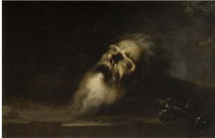
San Pablo. Estado final de la obra tras la intervención.