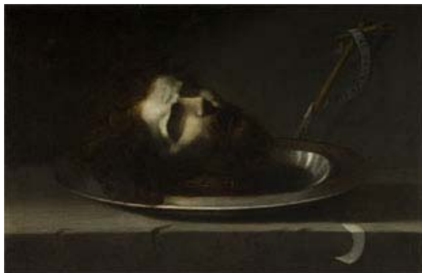
San Juan Bautista. Estado final de la obra tras la intervención.