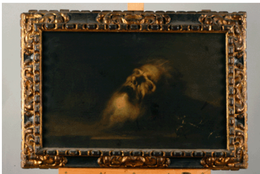
Cabeza de San Pablo, Sebastián de Llanos Valdés. 1670

Como viene siendo habitual en todas las obras procedentes del Salvador, la primera medida fue someter a los cuadros a una desinsectación preventiva por medio de la aplicación de gas inerte (Argón). A continuación se realiza un diagnóstico en base a la información obtenida del examen visual preliminar, las fotografías de infrarrojos e ultravioletas y los resultados de los análisis de las muestras estratigráficas: una muestra estratigráfica es un pequeño