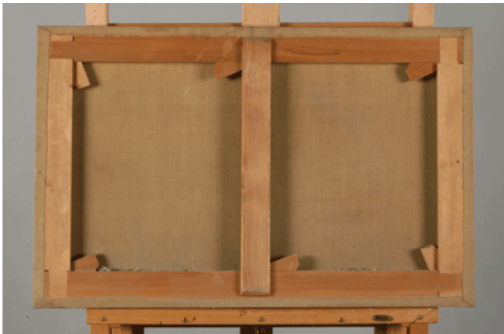
Bastidor de madera de pino.

La obra fue sometida a una intervención anterior en la que se reenteló y se colocó un bastidor de madera de pino. Tanto el soporte pictórico original como el posterior es tela de lino armado en tafetán. Esta intervención anterior ha sido decisiva en el estado de conservación de los cuadros. Su eficacia, por ejemplo, se ha puesto de manifiesto en la correcta fijación de la imprimación y en el buen estado de conservación del soporte pictórico.