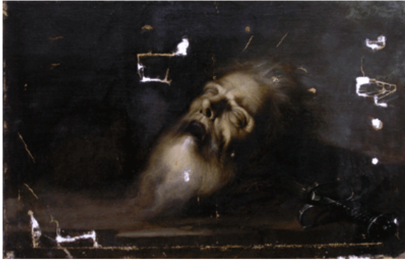
Lagunas en el cuadro de San Pablo

Limpia y barnizada la capa pictórica, se aplica en las lagunas reestucadas una base de color similar al de la preparación. A continuación se reintegran las lagunas a base de líneas y puntos, así se consigue una visión unitaria de la obra si se observa a cierta distancia, y se identifica claramente como una intervención si se observa el repinte de cerca.